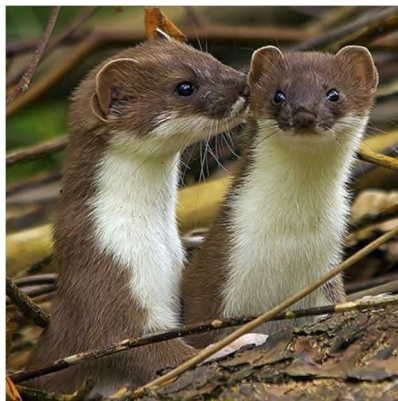
Рис. 1. Куница лесная в природе