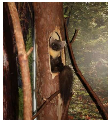
Рис. 2. Куница в зоопарке