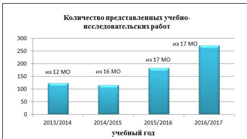
Рис. 2. Количество представленных учебно-исследовательских работ и участников муниципальных образований Республики Коми.

Ежегодно растет количество представленных учебно-исследовательских работ и участников муниципальных образований Республики Коми (Рис. 2).