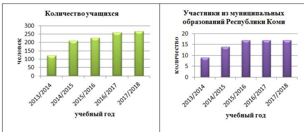
Рис. 1. Количество учащихся и участников из муниципальных образований по годам обучения.

учебный год) до электронного (дистанционного) обучения (2015/2016 - 2017/2018 учебные года). На рисунке 1 видно численное количество учащихся и количество участников из муниципальных образований по годам обучения. В Республиканской площадке обучаются учащиеся из 17 муниципальных образований Республики Коми (всего в Республике Коми их 20).