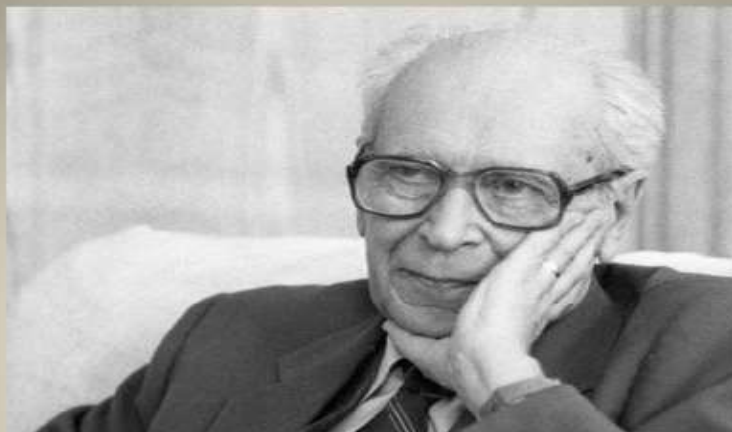
Дмитрий Сергеевич Лихачёв (1906 , Санкт Петербург - 1999 , Санкт-Петербург) - советский и российский филолог, искусствовед, академик РАН . Автор трудов, посвящённых русской литературе и русской культуре

Дмитрий Сергеевич Лихачев – светоч русской культуры, академик, ученый, общественный деятель, великий гражданин и патриот своей страны. Известный актер, народный артист России Игорь Дмитриев писал о нем: «Гордость русского народа, гордость интеллигенции. Я не знаю, кто сможет занять его место, и кто сможет иметь право говорить так о любых проблемах российской культуры с таким знанием и с такой болью за нее».